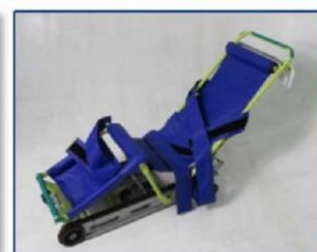
▲キャリダン(非常用階段避難車)