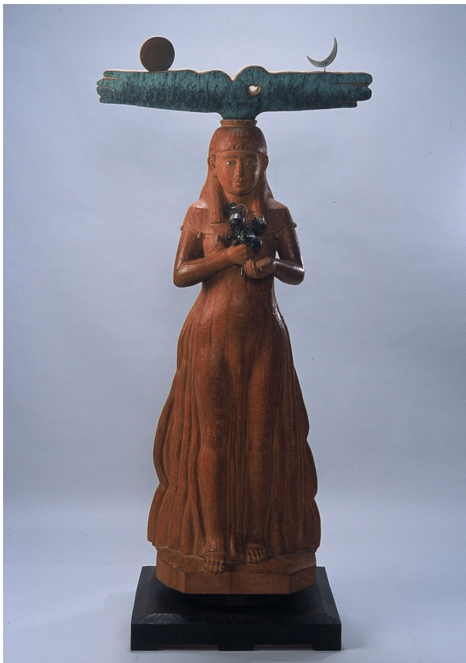
左上：「花園の歌」左下：「花」右：「日月花」