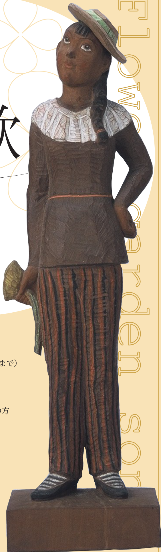
圓鏢勝三「黄色い花」