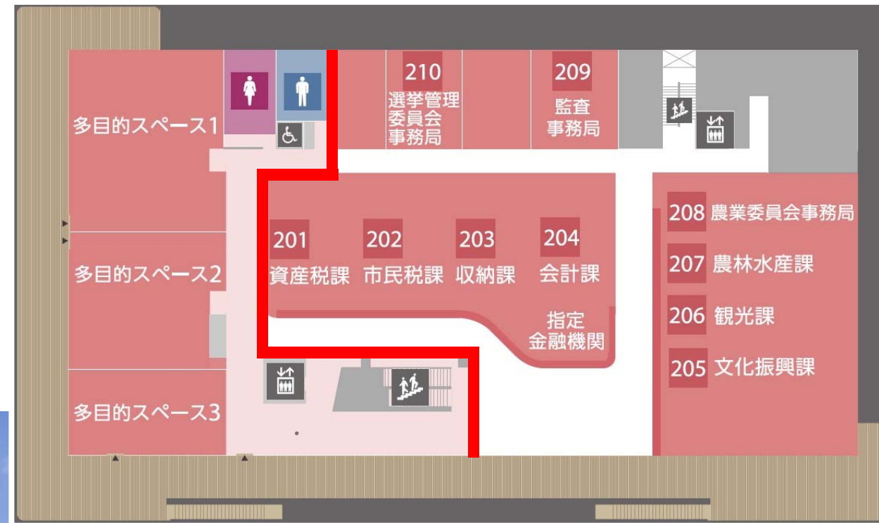
市民窓口（税務ほか）、執務室 多目的スペース 2階

本庁舎の開放スペースは、毎日 朝 8 時 30 分から夜 9 時まで ご利用いただけます。