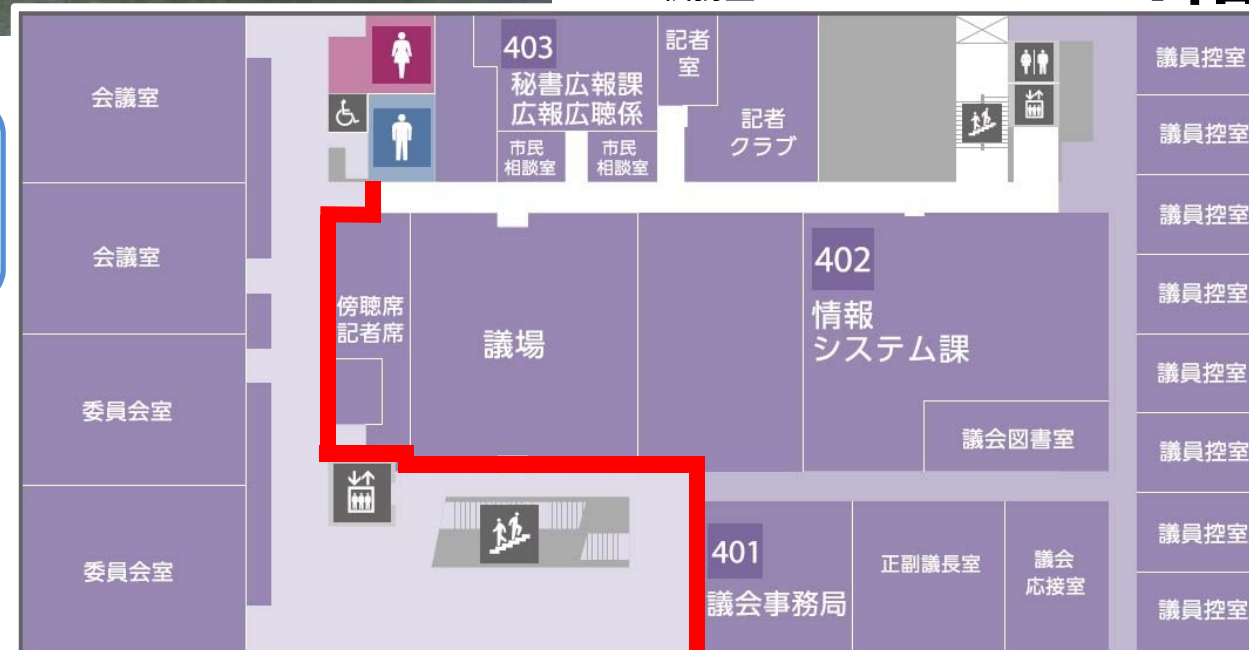
市議会議場、報道関係者室 執務室 4階

屋上 屋上（5階）は、休日・夜間も開放する展 望デッキになっています。尾道三山や尾道 水道の風景をお楽しみいただけます。