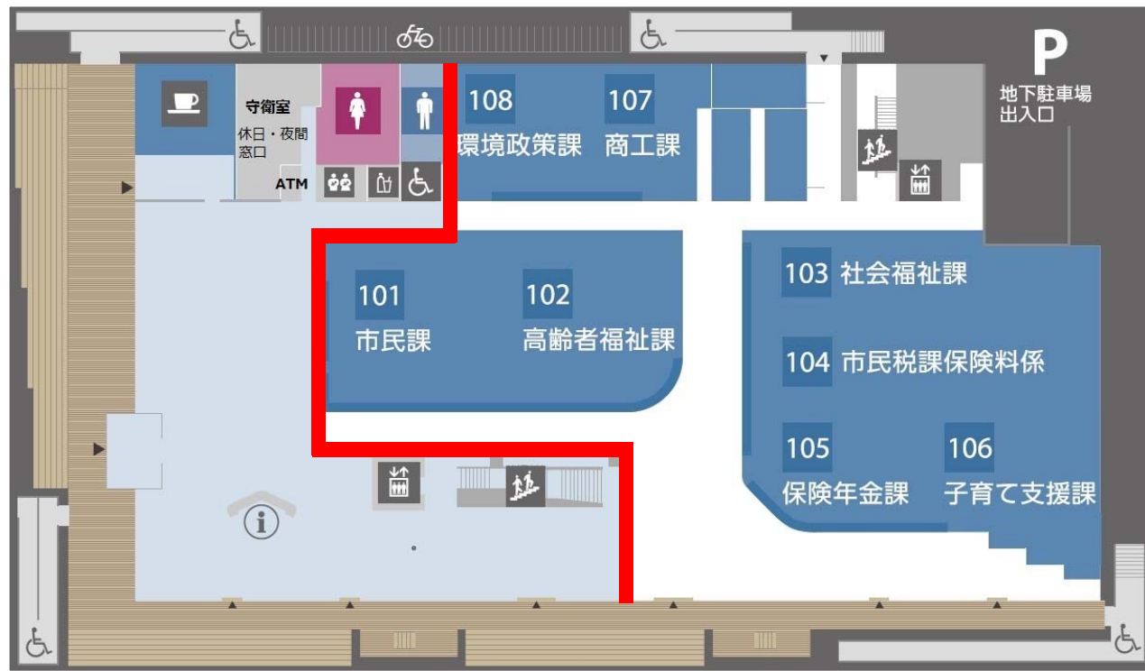
1階 市民窓口（市民課・福祉ほか） 守衛室（休日・夜間窓口） ATM、カフェ