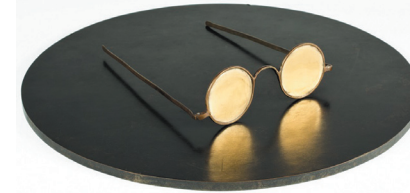
Yoko Ono Untitled, 1998 Bronze 30cm diameter Photo:Michael Sirianni©Yoko Ono