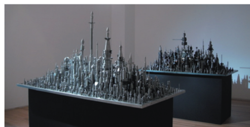
模型「RPM-1200」《Unearthing》 photo by Yoshie Ikeuchi ©Chu Enoki

尾道と鞆の浦を舞台に、街を回廊しながら、点在した現代アート作品を鑑賞できます。難しいと思われがちな現代アートを身近に感じてもらえる内容となっています。