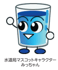
水道局マスコットキャラクター みっちゃん