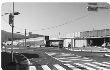
都市計画道路長江線

生活に密着した社会基盤の水準を引き上げ、暮らしの快適性、安全性を高めるため、緊急度、重要度、効率性等を総合的に判断し、優先度の高い箇所、地域から段階的に行ってまいります。