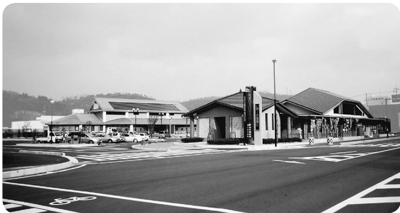
道の駅「クロスロードみつぎ」

件整備である、雇用の場所の企業誘致を目指すべきだと思いますが、考えをお尋ねします。