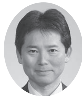
Withおのみちの声 このみや 二宮 仁