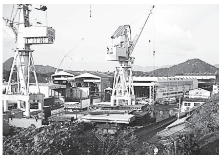
通勤時に混雑する県道(家老渡～安郷)

③この道路の終点部の折古地区の道路整備を優先したいと考えています。地蔵鼻への道路拡幅については、観光資源の活用策や用地確保などの諸課題があることから、今後、研究します。