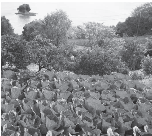
段々畑のキャベツと柑橘

います。本市では米・野菜・柑橘などの果物等多種多様な農産物が栽培されています。「農業振興ビジョン」を策定し、本市農業の統一の考えを持つて農業振興に取り組んでいます。②国の各種制度を利用したり本市独自の制度により後継者の育成・確保に取り組んでいます。新規就農者のための相談窓口の設置に向けた協議も始めています。③農業塾を実施しているJAと連携するとともに、地域農業を支える担い手として育成する施策を研究していきます。