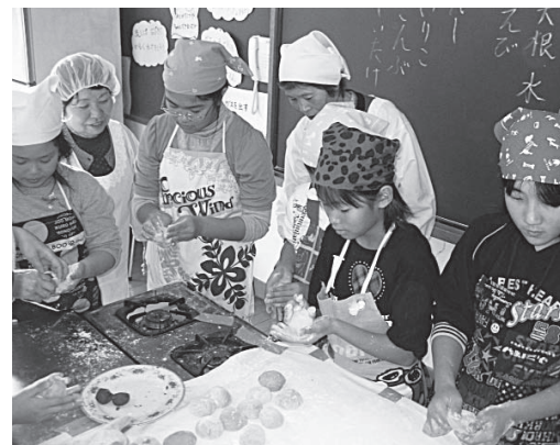
郷土料理教室(お雑煮づくり)

答 土曜授業の目的や実施日数などの大きな方向性を示し、各校がその地域の実情に応じて、進めていくことが適切であると考えています。地域の人材や教材の用意、施設の活用など、各学校の実態を踏まえた学習プログラムを作成することが必要となりますので、実施に向けて、効果的であり方など、より具体的に検討してまいります。