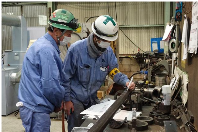
(3) 実技研修-マーキング