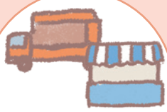
イベントブース キッチンカー