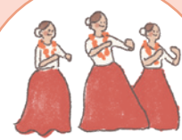
館内外ステージ パフォーマンス