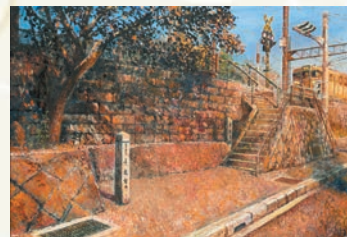
「帰り道」 永江 晶博 (滋賀県) 油彩画