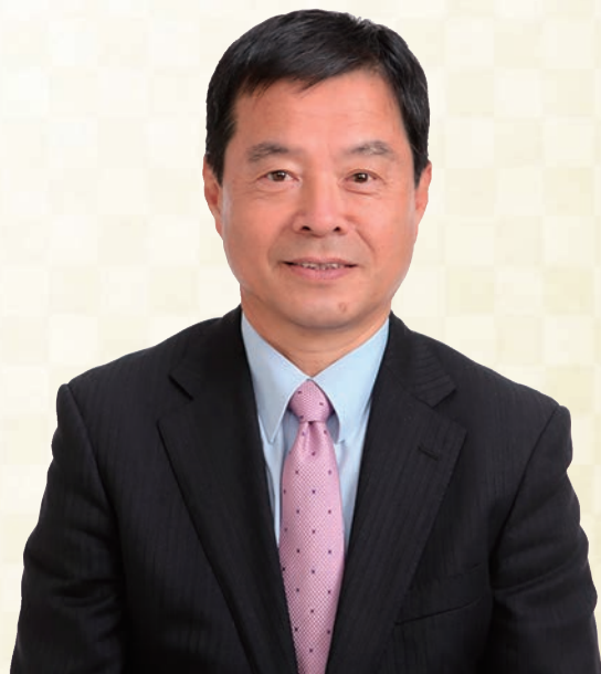
尾道市議会議員長

年の初めにあたり、市民の皆様のご健勝とご多幸をお祈り申し上げまして、新年のごあいさつとさせていただきます。