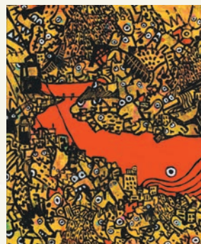
「尾道水道パラダイス」 木和田 美有 (広島県) アクリル画