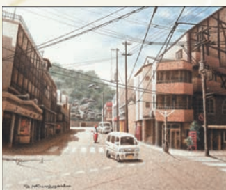
「屋下がりの交差点」 國安 建司 (広島県) 水彩画