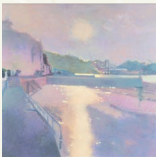
「尾道の朝日」 角谷 心平 (東京都) 油彩画