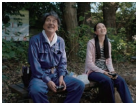
『PERFECT DAYS』配給:ピタース・エンド ©2023 MASTER MIND Ltd.