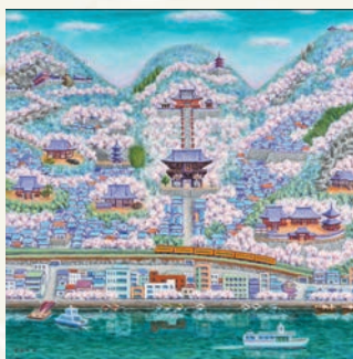
「桜咲く寺の街(尾道)」 碓木 學 (広島県) 油彩画