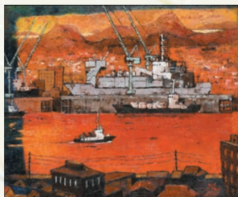
「海峡」 下島 悦嗣 (山口県) 油彩画