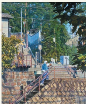
「九月」 中島 順平 (神奈川県) アクリル画