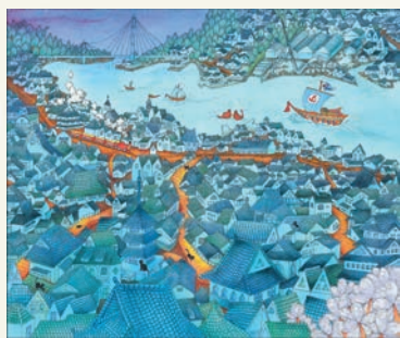
「おのみち今昔物語」 加藤 美代子 (広島県) アクリル画