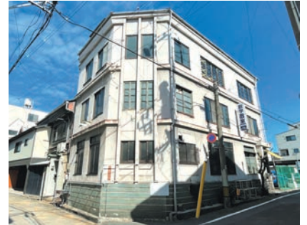
旧小野産婦人科医院