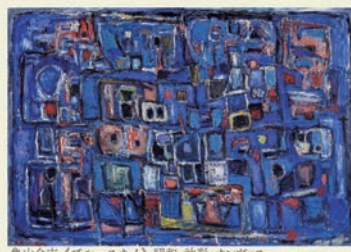
亀倉金吉「アムラツサイ」昭和 画彩・カンヴァス