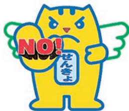
贈らない・求めない・受け取らない