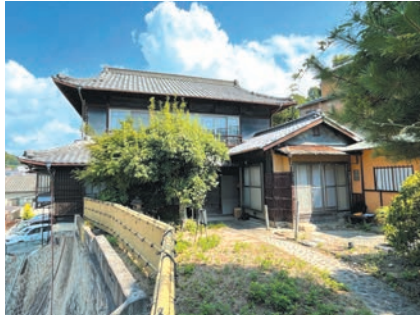
旧小林家住宅主屋