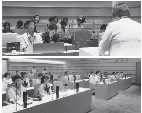
議員の答弁を真剣に聞く学生議員