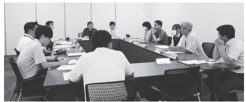
市議と学生議員との意見交換会