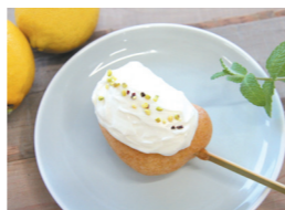
▲昨年度グランプリ 「けいまドッグ レモンマスカルポーネ」 (桂馬蒲鉾商店)

■尾道スローフードまちづくり推進協議会事務局(農林水産課内) (☎0848-38-9212)