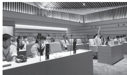
《リハーサルの様子》