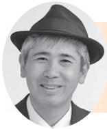
潮風おのみち かむり まさてる 冠 匡晃