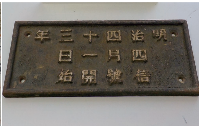
▲大浜埼通航潮流信号所開始板

古来より、瀬戸内海は京都大阪と西日本、そして国外へと続く海の道でした。船の航路は、瀬戸内海の島をぬける海峡を経由し、尾道や瀬戸田など、主要な港町沿いにありました。その中で、布川瀬戸や尾道水道は、主要な船舶が往来する重要な航路となっていました。そして、大型船も通航可能な布川瀬戸には、村上海賊の時代から、北前船が往来する近世・近代にいたるまで、航路を見張る城跡や遠見番所が設置されています。