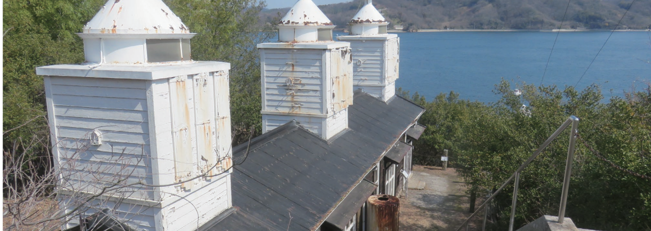
▲旧通航信号塔 外観