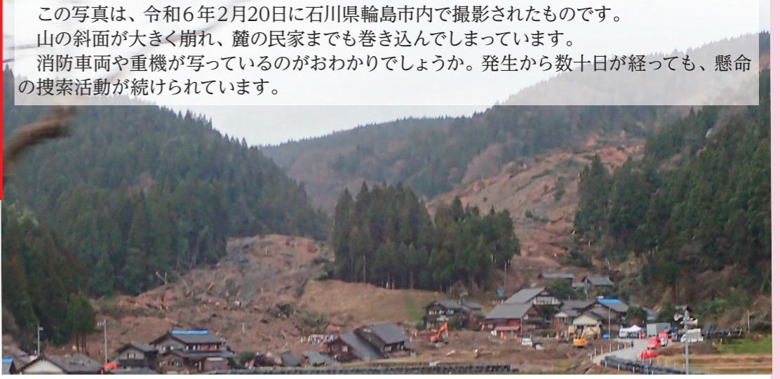
この写真は、令和6年2月20日に石川県輪島市内で撮影されたものです。山の斜面が大きく崩れ、麓の民家までも巻き込んでしまっています。消防車両や重機が写っているのがおわかりでしょうか。発生から数十日が経っても、懸命の捜索活動が続けられています。

写真の場所の周辺では、土砂災害の危険性が高い場所(土砂災害警戒区域・特別警戒区域に指定されている区域)が多数見られます。 いつ発生するかわからない地震に対しては、事前に逃げるというのは困難ですが、危険性を認識しておくことで、いざという時、行動に差がうまれます。 一方、雨に対してはどうでしょうか? 一般的に、雨の降りはじめから突然土砂災害が発生する可能性は低く、土砂災害の発生まではある程度の降雨があります。つまり、 危険から逃げるための時間は残されているのです。