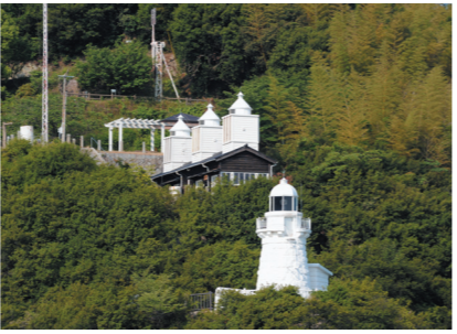
大浜崎通航潮流信号所