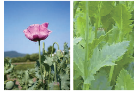
ケシの花 ケシの葉

「けし」は、葉や茎が白っぽい緑色で、茎は太く、ほとんど無毛で、葉は茎を巻き込むように付いているのが特徴です。「けし」や大麻は、麻薬成分を含むため、法律で栽培が禁止されているものがあります。見かけたり判断がつかなくなったりするときは、ご連絡ください。