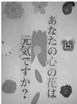
[平成27年中学生の一部最優秀作品]