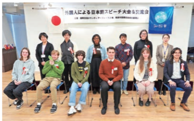
尾道市国際交流推進協議会事務局 (秘書広報課内 ☎0848-38-9395)