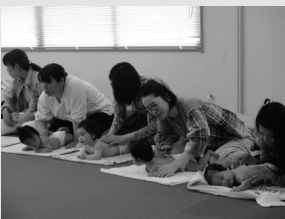
おのみち子育て支援センター(タッチケア)

掲載以外でも子育て講座、出前講座を行っています。 育児・栄養に関する相談や、子育て情報の提供もできます。