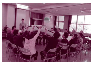
レクリエーション技法の実技