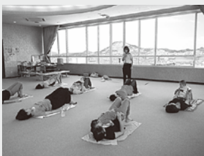
産後ママのヨガストレッチ(いんのしま子育て支援センター)

掲載以外でも子育て講座、出前講座を行っています。 育児・栄養に関する相談や、子育て情報の提供もできます。