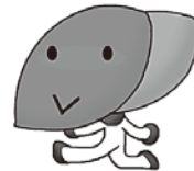
厚生労働省 肝炎総合対策の マスコット「肝ちゃん」

す。感染者の多くは自覚症状がなく、放置すると肝硬変や肝がんに移行することもあります。病気の進行を防ぐには、肝炎ウイルス検査による早期発見と適切な治療が大切です。