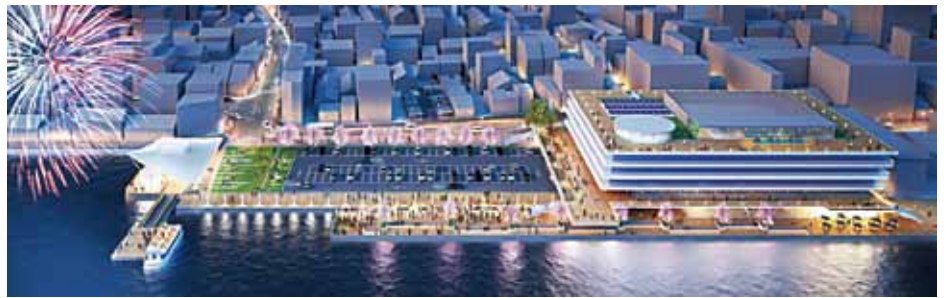
総額60億円の構想を基に提案された新庁舎イメージ(無断転載を禁止します)