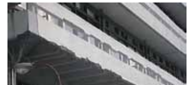
コンクリートが剥離した現庁舎

老朽化した建物に多額の費用を投じて改修するのではなく、22世紀の子ども達に誇れる公共空間を創ることが現代の私たちの責任と考え、建て替えることで市民サービスの向上を図り、魅力ある空間を尾道の中心市街地に創出することを目指しています。