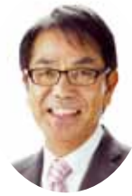
尾道市長 平谷祐宏