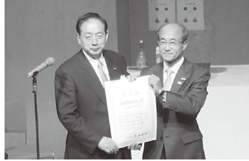
選定証授与式の様子

今までの地域活性化の取り組みが評価され、また今後の優れた企画が重点支援により効果的な取り組みが期待できるものとして、重点「道の駅」(国土交通大臣選定)に選定されました。