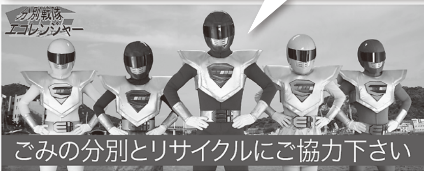
分別戦隊エコレンジャー

雨の日も、風の日も、暑い日も、寒い日も、パッカー車は休みません。このような車を見たらご協力をお願いします。