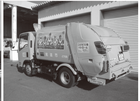
パッカー車(ごみ収集車)

市民の皆さんが出したごみは、パッカー車等で収集を行っています。交通状況・歩行者等十分に気を付け、安全な収集作業に努めていますが、狭い道での作業時など、車の離合にお待ちいただくこともありますのでご理解ご協力をお願いします。