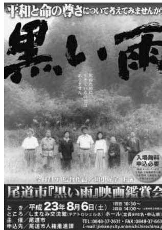
今村昌平監督作品 田中好子主演