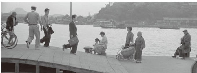
喜びも悲しみも 一円五〇銭の渡し船 -「着岸」昭和28年頃(1953)