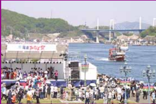
開会・閉会セレモニーが行われた メインステージ