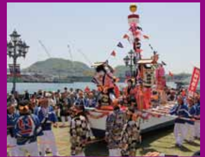
姉妹都市松江市の伝承ホーランエンヤ