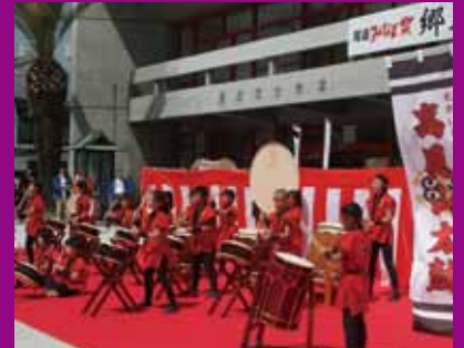
郷土芸能祭には地元太鼓団体が出演