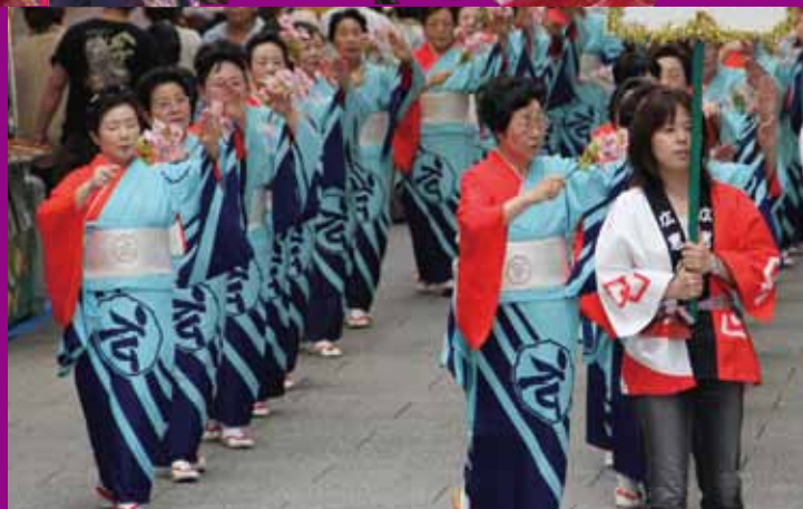
商店街での一般パレード