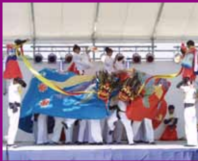
姉妹都市今治市の継ぎ獅子