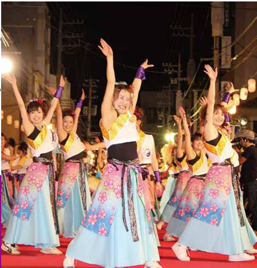
グランプリ部門は空修会館が見事連覇!