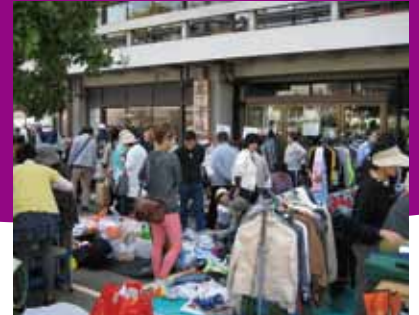
掘り出しものがたくさん!フリーマーケット