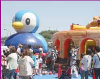
子どもたちに人気の遊具もたくさん