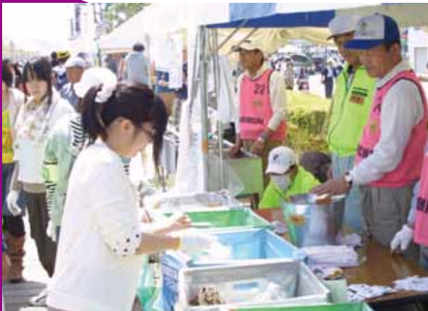
ごみの分別回収。きれいな祭をめざして