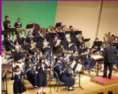
息のそろう音色が響いた春の吹奏楽祭