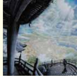
尾道観光協会奨励賞 「尾道情景」 加鹿幸司(山口県) その他