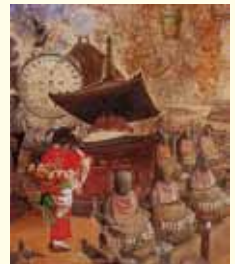
尾道銀行倶楽部奨励賞 「尾道幻想2013—火伏観音のための下絵」 植松 誉(静岡県) 油彩画