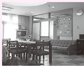
緩和ケア病棟のテイルーム