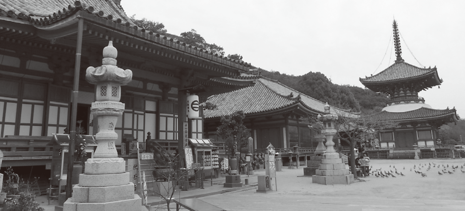
▲写真左から、本堂、阿弥陀堂、多宝塔