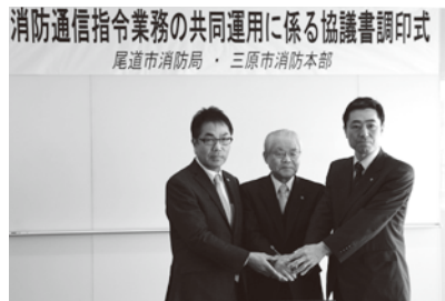
消防通信指令業務の共同運用に係る協議書調印式 尾道市消防局・三原市消防本部