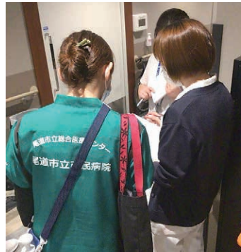
▲訪問先施設職員への指導場面