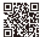
au・ソフトバンク用