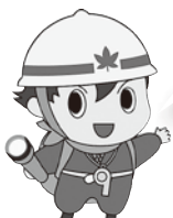
ジスケ (タスケ三兄弟)