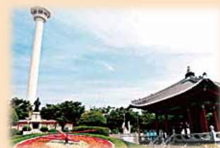
▲龍頭山公園 釜山タワー