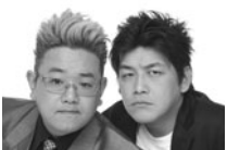
サンドウィッチマン