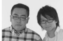
どきどきキャンプ