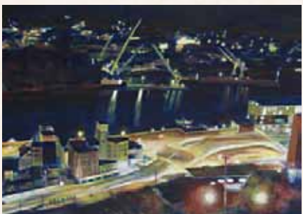
「尾道の夜景」 芦田さくら 京都精華女子高等学校(京都府) デザイン画