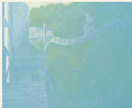
「明仄」 花房春菜 県立熊野高等学校(広島県) アクリル画