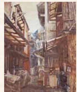
「家路」 竹重美里 市立基町高等学校(広島県) 日本画