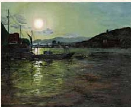
「海、眺めて」 湯場 伊吹季 県立岩国高等学校(山口県) アクリル画