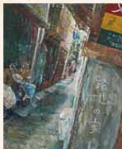
「路地の家」 倉迫花名 鈴峯女子高等学校(広島県) アクリル画