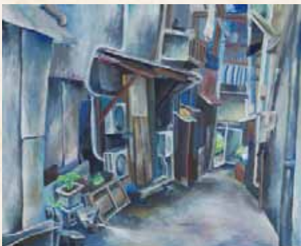
「尾道の路地裏」 豊永さつき 県立太宰府高等学校(福岡県) アクリル画