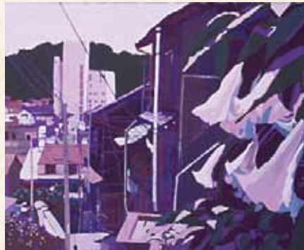
「ユリ」 中園 響 県立安芸府中高等学校(広島県) アクリル画