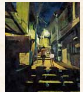
「驟雨」 齋藤真衣 県立岩国高等学校(山口県) アクリル画