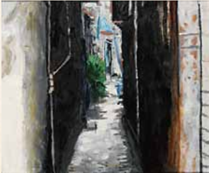
「尾道の細道」 内尾博彰 真颯館高等学校(福岡県) 油彩画