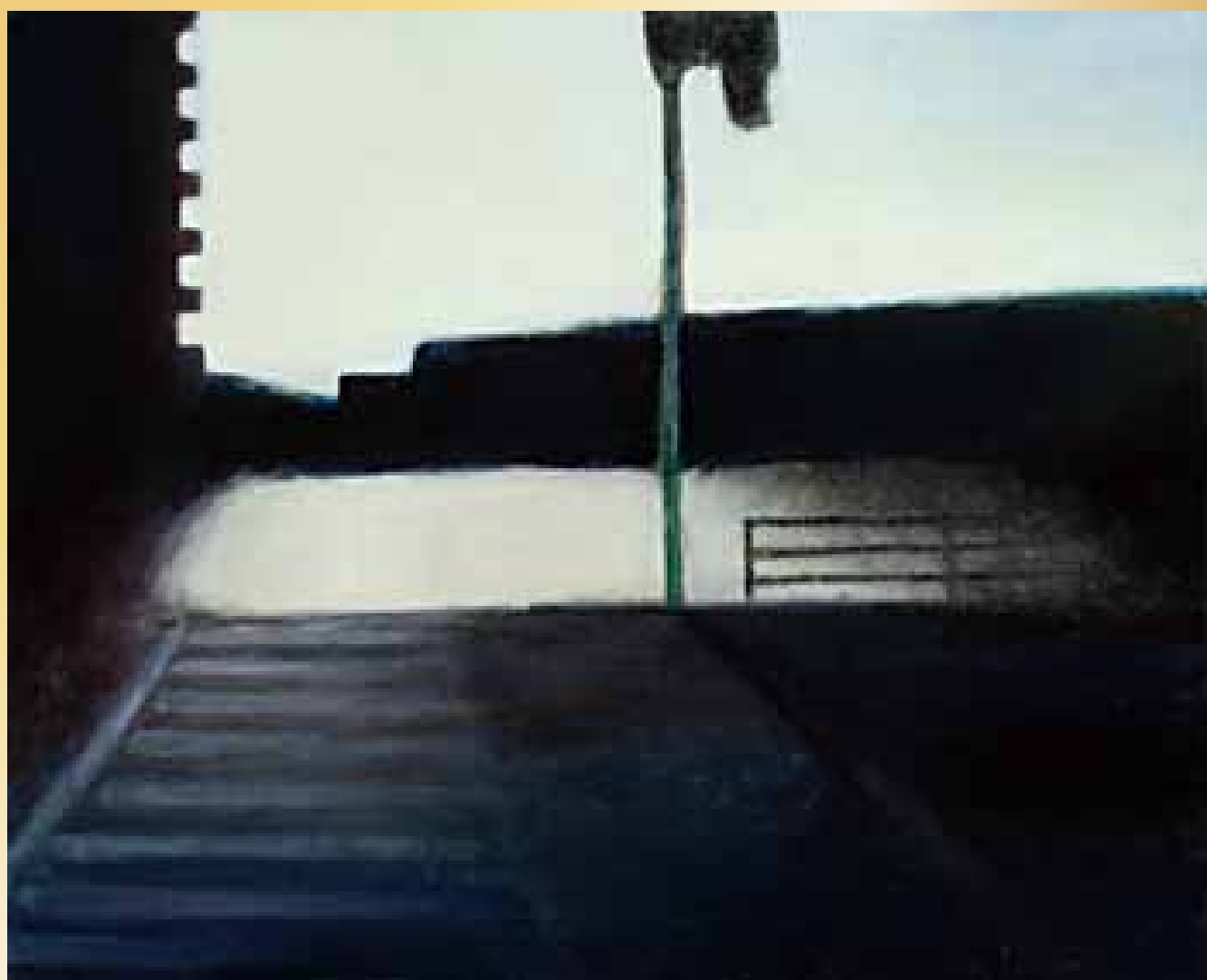
第7回高校生絵のまち尾道四季展 秀作作品