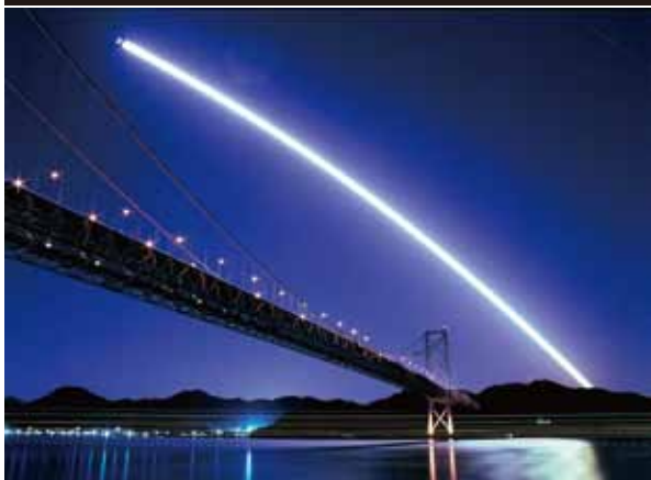
ノクターン・オノミチ 小田原 健(尾道市)