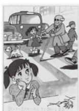
「困っている人がいたらすぐ助ける 勇気」ちばてつや