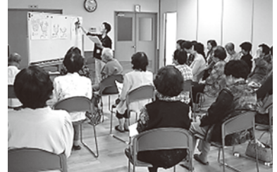
認知症予防の講演

おのみち子育て支援センター (☎0848-37-2409)月～金曜日(祝日除く)9:00～17:00