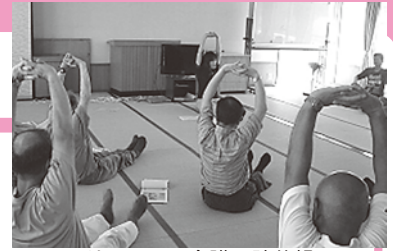
サロンでの介護予防体操