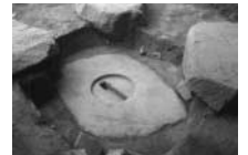
本郷平麿寺の塔心礎