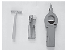
容器包装プラスチックに入っていた「丁字カミソリ、ライター」