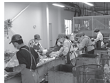
収集した容器包装プラスチックは手作業で選別しています。