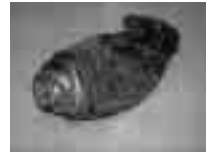
発火した穴を開けていないスプレー缶