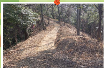
山頂まで登りやすい登山道を整備