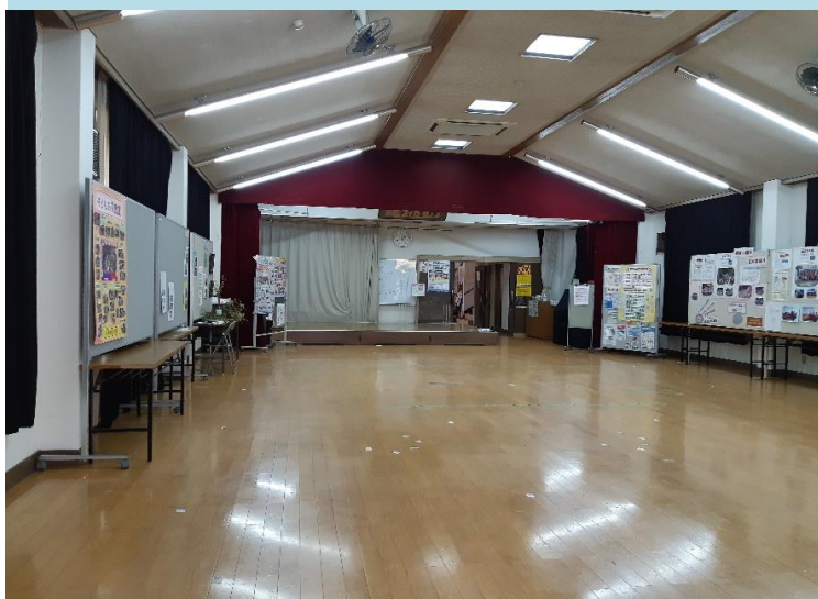
大ホール (139.5㎡) 約15m×8.8m

机 20台 椅子 7脚 モニター 1台 舞台 スクリーン マイク ホワイトボード ピアノ