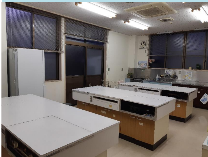
調理室 (33.5㎡) 約4.5m×7.5m

調理台 3台 ガスコンロ 4台 電子レンジ 1台 ガス炊飯器 ガスレンジ 冷蔵庫 調理器具一式 電気ポット