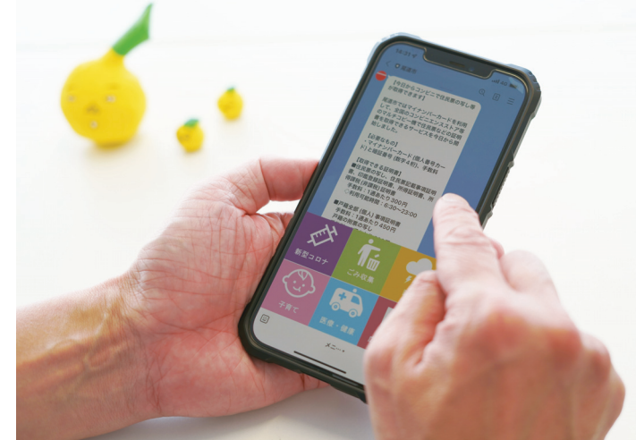
▲尾道市公式LINEメインメニュー