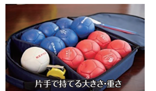
片手で持てる大きさ・重さ