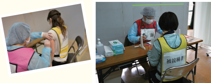
▲集団接種会場シミュレーションの様子