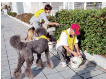
僕たちもお掃除だワン♪

飼い主の意識向上の取組の一環として、飼い犬と一緒にいつもの散歩コースを清掃する「クリーンわん清掃活動」を行っています。その中で一番多いのはタバコの吸い殻ですが、気になるのは犬猫のフンが植え込みの中や路上に放置されていることです。