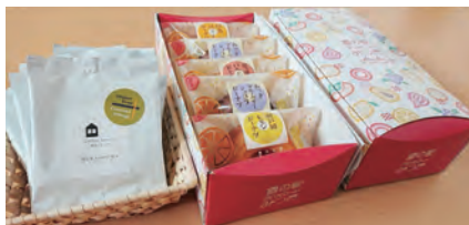
15時のおやつセット