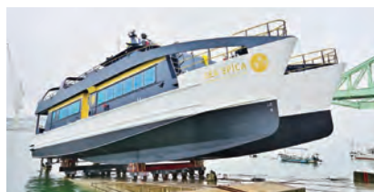
尾道で建造されたシー スピカ