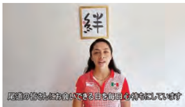
尾道の皆さんにお会いできる日を毎日心待ちにしています