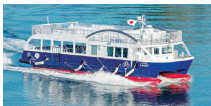
尾道～瀬戸田間を運航するサイクルシップ ラズリ

なぜJR西日本は「鉄道のない島」への誘客を進めるのか謎が解かれました。これからもせとうちパレットプロジェクトから目が離せませんね。