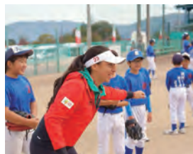
▲▼2019年11月に行われたキャンプの様子