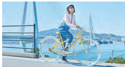
レモンバイクはその名の通りまっ黄色

建造への出資、尾道のメーカーとコラボした自転車「SHIMANAMI LEMON BIKE」のレンタル開始、地元企業と協力した商品の開発・販売など、一見鉄道事業に関係ないと思われることもやっています。しかしこれらも、せとうちパレットプロジェクトには大切な事業たちなのです。