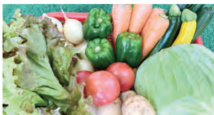
みつぎの三ツ星野菜便