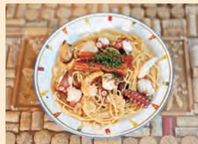
▲あなごとタコのおのみち風