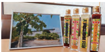
尾道パイヤドレッシングセット