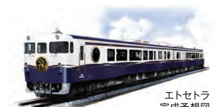
エトセトラ 完成予想図

■料金や申込方法の記載のないものは無料または申込不要です。 日・時・期間 対対象 内容 定員 料金 申込方法 申込先 場所 問い合わせ先 電話 定員 フォックス 保持物 電子メール 縮切 HP ホームページ