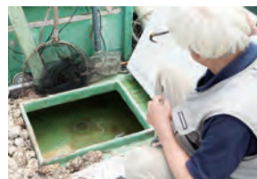
▲船の中には生簀があり、生きたままの魚を出荷できるようになっています。