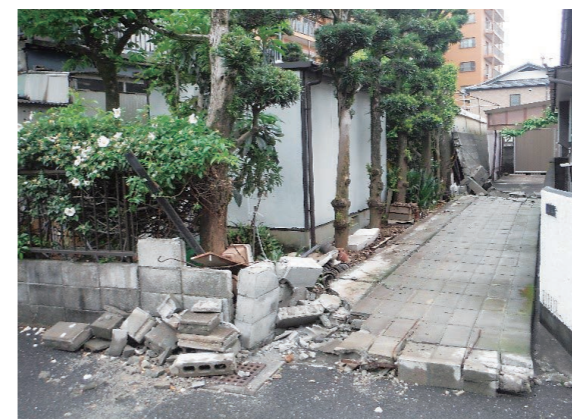
熊本地震でブロック塀が崩れた様子