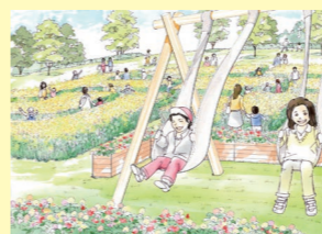
花迷路・尾道帆布のブランコ(イメージ)

冒険の森には、花壇やお花の迷路が出現。はなのわ期間限定の「尾道帆布のブランコ」も楽しめます。