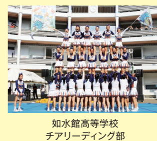
如水館高等学校 チャリディング部